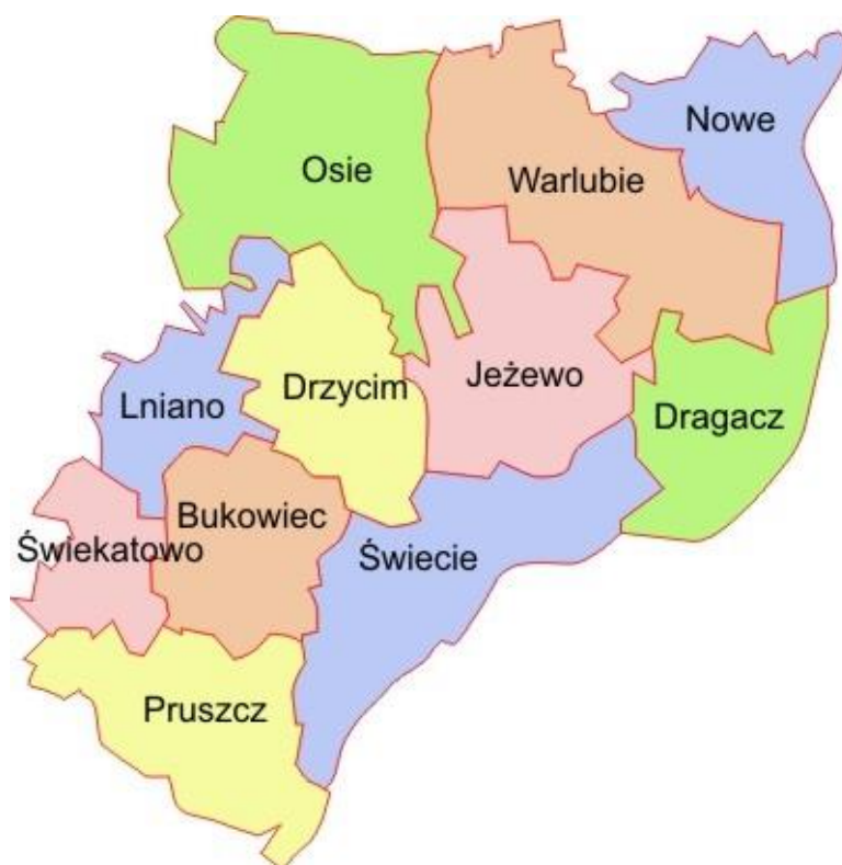
Rysunek 1. Gmina Warlubie na tle powiatu świeckiego

Powierzchnia gminy Warlubie wynosi 200,97 km 2 , a według danych z 2020 roku ludność Gminy wynosi 6.464 mieszkańców. Gęstość zaludnienia to w przybliżeniu 32 osób/km 2 .