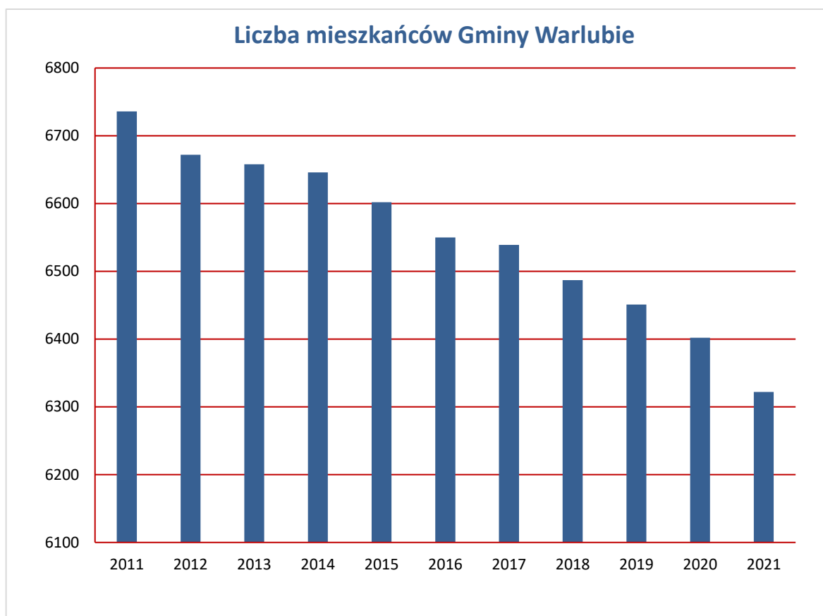
Rysunek 1 Zmiana liczby mieszkańców Gminy Warlubie w latach 2011-2021

W 2021 roku w Gminie Warlubie zawarto 25 małżeństw (14 konkordatowych i 11 śluby cywilne). W tym samym roku w Księgach Aktów Stanu Cywilnego zarejestrowano 7 wyroków w sprawach rozwodowych. W 2021 roku dla 6 par wystąpiono o nadanie Medalu za Długoletnie Pożycie Małżeńskie.